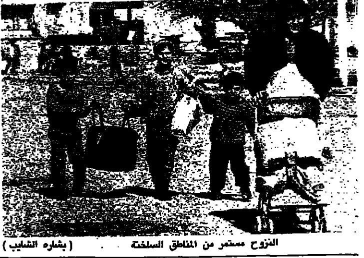
الزوج مستمر من المناطق الساخنة (يشارة الشايب)

هل بدأت رحلة العودة الى الحياة الطبيعية في المنطقة الشرقية. بعد كلوس امي حول حياة الناس فيها جميعا من الحديد والنفط استمر اكثر من شهر. والجواب بالاجابة من هذا السؤال الذي دار في خاطر اللبنانيين. ظهرت لامرحة مساء امس بعد يوم. مكوي. للجنة الوساطة واجتماعات متلاحقة. محورها القصر الجمهوري في بعثا ويكرى وجونيه. انصبت أساسا على تركيز وقف النار. في ظل تراجع الحملات الاعلامية. وتوجه مساء بنصرينات للجنة الوساطة تعلن ان الاجراءات الجارية جدا. وبعد انتهاء الاجتماع قرابة التسعة مساء. خرج عضوا لجنة الوساطة. واعلن الاباتي نعمان ان الاجراءات ممتازة والدراس يسير بسرعة. وان شاء الله الطبع يسير بطريقة سريعة جدا. ان اول شيء حصل اليوم (امس) هو الطبع الاعلامي. وتبادل ايضا وسائل الاعلام ان تنفيذ حربيا بالعمليات التي وصلت اليها من الذين اعطوها. وهكذا تساهم في تثبيت الاجواء الطيبة التي تاتي بالمطمانينة والثقة الى الشعب المحتاج جدا الى الطمانينة والسلام. وقال المحامي ابو سليمان: ليس لدي شيء ازيد على ما قلته الاباتي نعمان. الاجراءات جيدة وعلى تحسين مستمر. وهناك خطوات عملية ستظهر يوما بعد يوم منها خطوات اعلامية اليوم (امس). وستطبع القول ان هناك خدمة اعلامية. لا بل ابدع من هدية. واكثر من هدية. وحصلت اجتماعات تفصيلية مع اصحاب العلاقة جميعا في الاعلام. وان شاء الله ان يلمس المواطنون اول الفرج اعلامي. لان